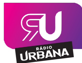
TABELA DE PUBLICIDADE RÁDIO

Surge, finalmente, a rádio que sempre desejou.